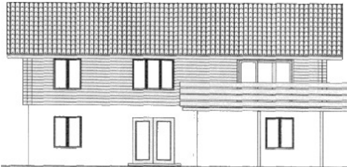
Rückansicht mit Balkon